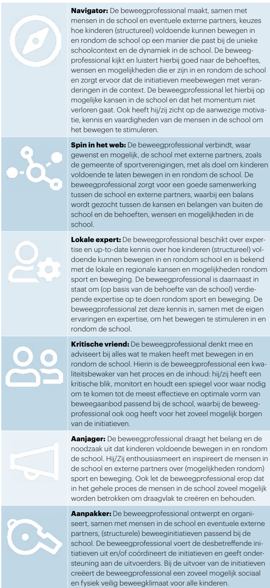
Tabel 2 Beschrijving van de rollen van beweegprofessionals in en rondom school

** Een beweegprofessional in en rondom een school is iemand die zich inzet voor het stimuleren van bewegen van kinderen. Hij/Zij is een echte ambassadeur van sport en beweging en focust zich op de schoolsetting. Binnen een school werkt een beweegprofessional vaak samen in een (beweeg)team, waarbij ieder zijn/haar eigen rol en verantwoordelijkheden heeft om er vervolgens samen voor te zorgen dat kinderen voldoende bewegen. Zes rollen kunnen hierin worden onderscheiden. Wie welke rol(len) op zich neemt kan per school verschillen, afhankelijk van welke beweegprofessionals betrokken zijn en de context van de school met daarin de school-specifieke behoeftes, wensen en mogelijkheden.